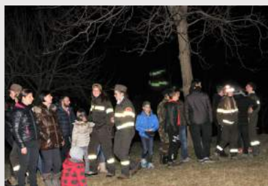
Carnevale a San Carlo

stagione Autunnale. Il rifacimento della pavimentazione (ormai radicata dal suolo dalle passate stagioni invernali), la tinteggiatura, la costruzione di nuovi loculi e altre piccole opere collaterali hanno permesso di ridare una nuova veste ad uno dei luoghi Sacri del nostro paese.