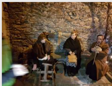
Alcune immagini del presepe vivente