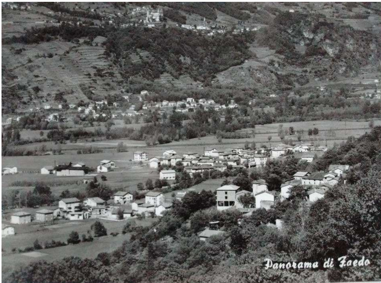
Panorama di Faedo Piano e della contrada Feruda ripresi dal dosso della Guardia