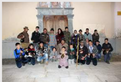
il gruppo che si è ritrovato per risvegliare l'erba