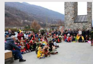
Sfilata di carnevale a faedo piano